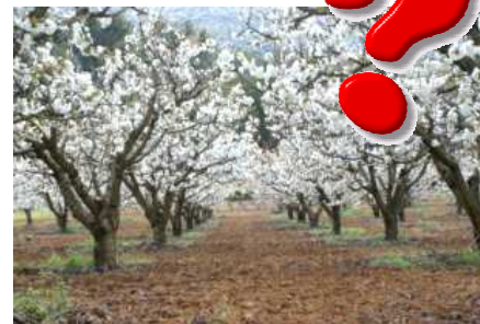
EVOLUTION de la DEMOGRAPHIE et de l'URBANISATION SUR MAUBEC.

Les graphiques étant plus parlants que des pourcentages et de belles déclarations d'intention, nous vous invitons à réfléchir sur les courbes comparatives du développement de la démographie (ci-dessous), donc de l'urbanisation, de Maubec avec quelques communes voisines et à constater par vous-même le résultat parlant de «cette croissance maîtrisée».